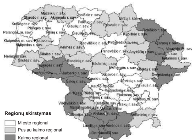
3 pav. Lietuvos regionų pasiskirstymas pagal kaimiškumą 2010 m. (sudaryta autorės pagal LR Statistikos departamento ir ViaMichelin GIS sistemos duomenis)

Analizės metu buvo atsižvelgiama į tai, ar važiavimo trukmė yra labai arti nustatytos ribos (45 min. arba 75 min.), pagal kurią regionas priskiriamas miesto, pusiau kaimo ar kaimo grupei. Daugiausia diskusijų šiuo klausimu iškilo dėl Elektrėnų savivaldybės, kuri yra tarp dviejų atrinktų didžiausių Lietuvos miestų – Vilniaus ir Kauno. Važiavimo trukmė – daugiau negu 50 proc. šio regiono gyventojų – iki Vilniaus yra 46 min., o iki Kauno – 47 min., t. y. viršija pasirinktą 45 min. ribą labai nežymiai. Šis regionas taip pat