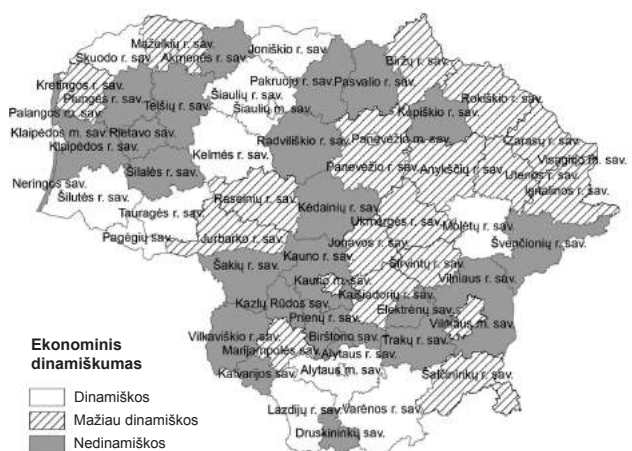
2 pav. Lietuvos regionų pasiskirstymas pagal ekonominį dinamizmą 2007–2009 m. (sudaryta autorės pagal LR Statistikos departamento duomenis)

Lietuvos regionai pagal taikytą ekonominiam dinamizmui apskaičiuoti metodiką buvo suskirstyti į 3 grupes: dinamiškus, mažiau dinamiškus ir nedinamiškus regionus. Lietuvos regionų pasiskirstymas pagal ekonominį dinamizmą 2007–2009 metais pavaizduotas 2 pav. Suskirstius Lietuvos savivaldybes pagal ekonominį dinamizmą, 10 savivaldybių (16,7 proc.) pateko į dinamiškų regionų grupę, 23 savivaldybės (38,3 proc.) buvo priskirtos mažai dinamiškų regionų grupei, o 27 (45 proc.) – nedinamiškų regionų grupei.