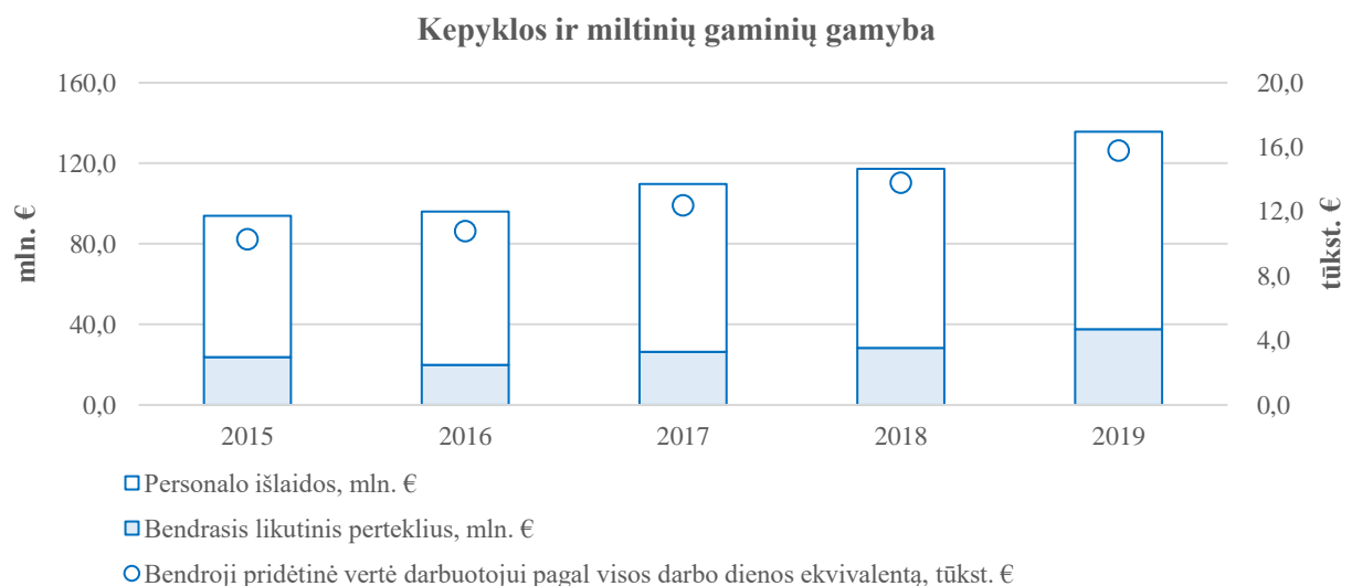
3 pav. Pridėtinės vertės (gamybos veiksmų kaina) struktūros ir bendrosios pridėtinės vertės darbuotojui rodiklių pokyčiai 2015–2019 m.: kepyklos ir miltinių gaminių gamyba

2015–2019 m. pridėtinės vertės (gamybos veiksmų kaina) rodiklis kasmet nuosekliai didėjo (3 pav.). Daugiau kaip 70,0 proc. šio rodiklio struktūros sudarė personalo išlaidos, o bendrojo likutinio pertekliaus dalis struktūroje buvo mažiausiai palanki 2016–2018 m. Lyginant 2019 m. su 2015 m., matyti, kad personalo išlaidų dalis struktūroje sumažėjo, o pats rodiklis išaugo, o tai rodo darbo jėgos brangimą nagrinėtu laikotarpiu. 2019 m. bendrosios pridėtinės vertės darbuotojui pagal visos darbo dienos ekvivalentą rodiklis buvo mažesnis negu tas pats visos maisto produktų gamybos grupės rodiklis.